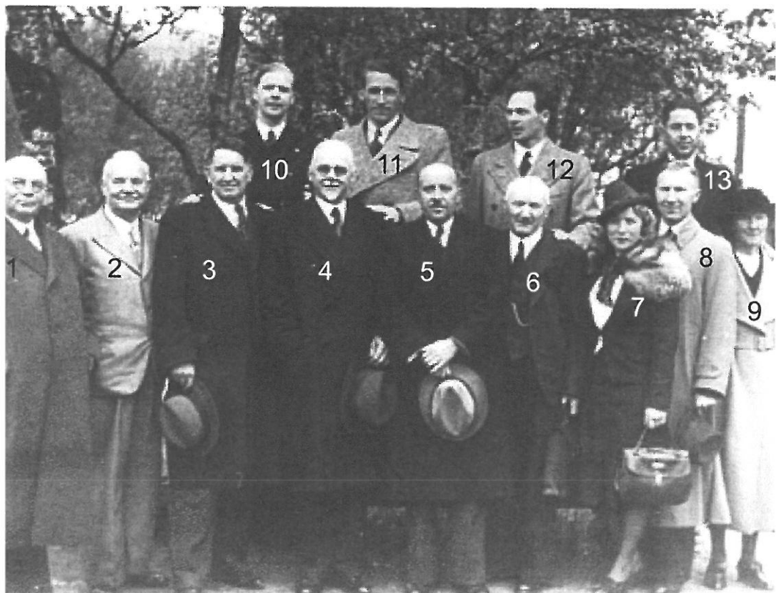
Kjenner du denne predikantflokken? Send oss navn! Personene er nummerert.