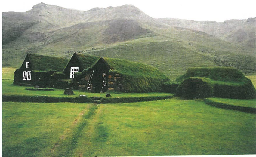
Ifølge Landnámabok var nordmenn de første bosetterne på øya i år 874 e.kr, da Ingolf Arnarsson slo seg ned der. Bildet viser gamle bygninger på et utendørs museum.