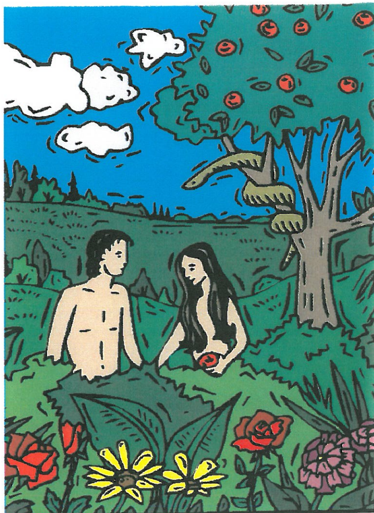
Ved skabelsen indstiftede Gud to betydningsfulde forordninger, Sabbatten og Ægteskabet. Træsnitt.

Ægteskabet kommer også fra Edens Have og