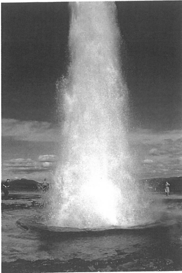
En av de berømte geysirs på Island