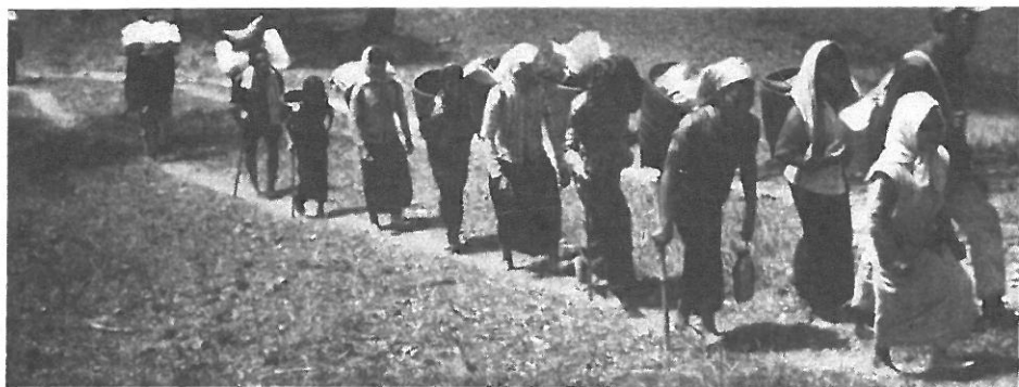
Noen av bærerne våre.

kom bare for å hjelpe folket. Taleren sa at de hadde ikke noe imot at vi lærte dem Bibelen og hjelp de syke. De kalte seg selv for "Frigjøringsfronten", og hvis vi ønsket å fortsette vårt arbeide etter frigjøringen, kunne vi gjerne det.