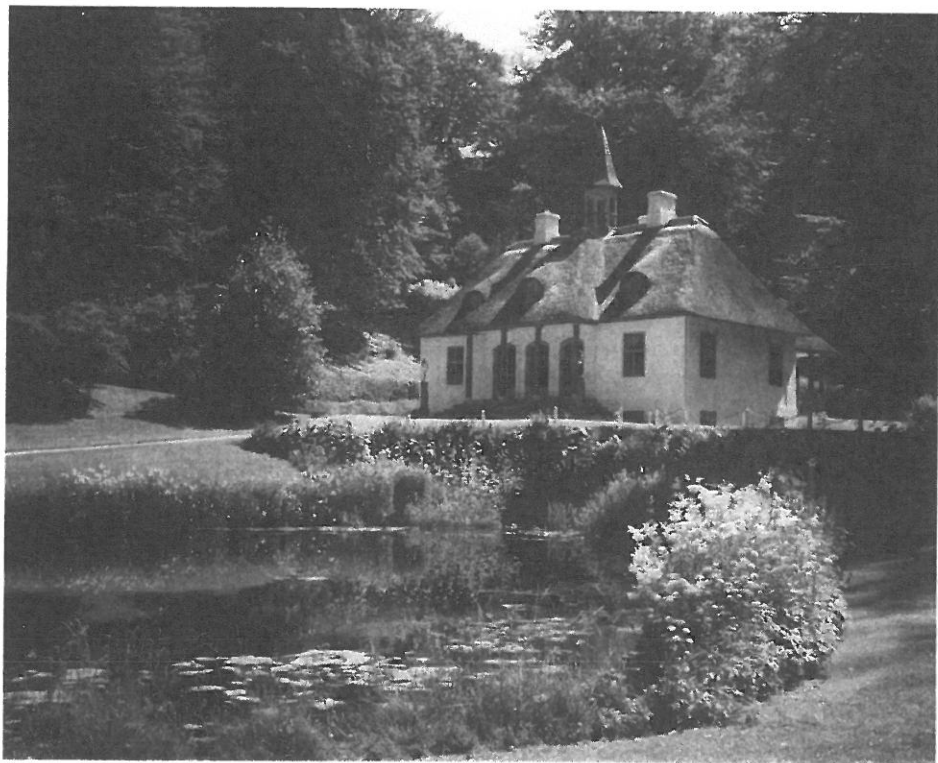
Fra Møens Klint

med det henrivende empire-jagtslot fra 1785. Godset Liselund er fredet i klasse A, og der hører en stor smuk park til området, som vi får anledning til at besøge, og for de friske bliver der en lille tur til stranden, hvorfra man får det bedste indtryk af de imponerende kridtklinter. På tilbageturen standser vi ved Præstekilde kro, hvor der serveres chokolade med boller og kringle, og turen afsluttes ved Søndervang. Prisen pr. deltager for middag på Søndervang, bustur og servering på kroen bliver omkring kr. 150 - 175. Af hensyn til arrangemen-