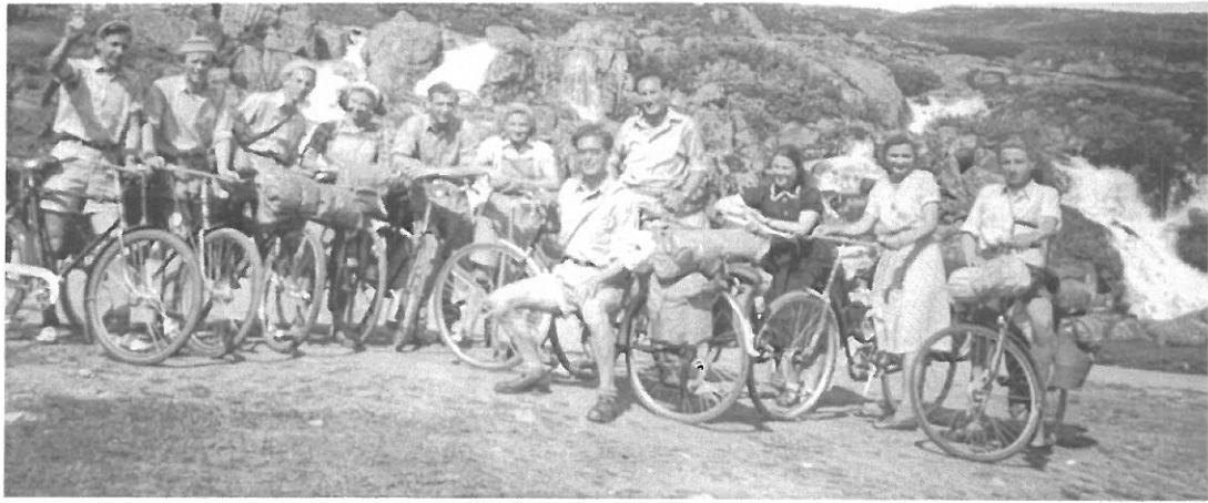
Ungdomslaget i Bergen på sykkeltur til Fyresdalstevnet i 1948.