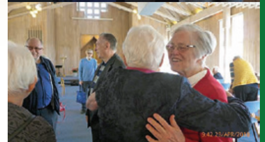
Det var vår og glede i luften da bortimot 90 personer kom sammen til treff i Moss