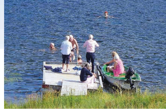
Mange badet om morgenen og når det ellers var pauser i programmet.