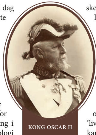
KONG OSCAR II

K ong Oscar 2. hadde ingen god dag 6. mars 1891, da han utnevnte Johannes Steen til norsk statsminister i spissen for den første regjering av bare Venstre. «Här förestod en strid på liv och död, det fattade jag.» Det var innledningen til «två och et halvt års jag – kan nästan säga politisk martyrskap.» Opptakten til unionsoppløsningen var den fremste politiske saken i 1890-årene. Men bakenfor foregikk det en nasjonal oppvåkning i Norge innen kultur og helse, teknologi og miljø – et betydningsfullt bakteppe også for Sunnhetsbladets utvikling og vekst.