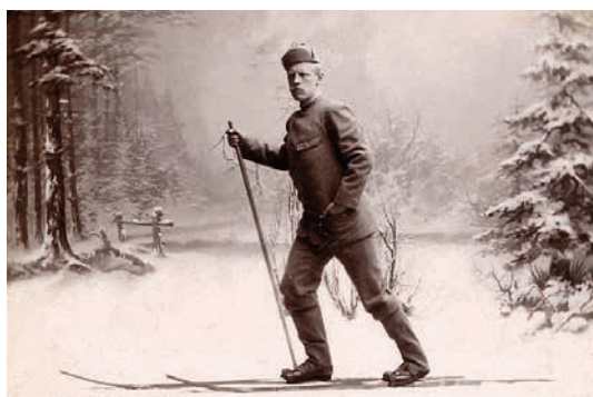
FRIDTJOF NANSEN FORENTE TIDENS INTERESSE FOR FYSISKE UTFORDRINGER OG FOLKEHELSE MED FORSKERTRANG OG NATUROPPLEVELSER.

Sunnhetsloven av 1860 hadde definert helseansvar for myndighetene, med helseråd, sykehus og