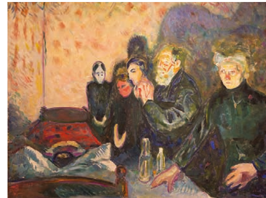
EDVARD MUNCH SØKTE Å UTTRYKKE MENNESKET'S VIRKELIGE SITUASJON OG EKSPONERE SINNETS SKJULTE DYBDER.

Noen protesterte. Bil og hest kunne ikke ferdes på samme vei. Hesten vil dessuten ha «ytterst van-