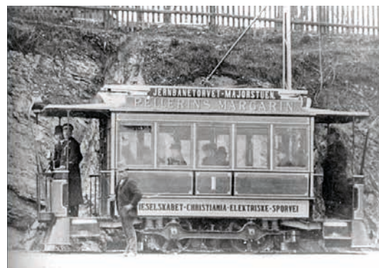
OSLOS FØRSTE ELEKTRISKE SPORVOGN (1894)

nye tider for skogbruk, jordbruk, fiske og sjøfart. Eventyret fikk en rask slutt med Kristiania-krakket i 1899. Boligmarkedet ble blåst over ende, fulgt av falitter og arbeidsledighet. Mange mistet livsgrunnlag, verdighet og håp. Også Sunnhetsbladets trykkeri fikk problemer, men ble reddet gjennom friske midler fra støttespillere i Amerika.