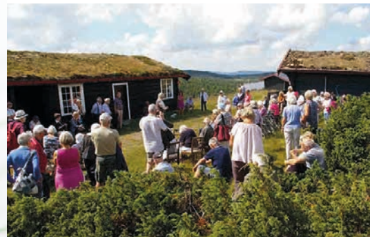
Hotellet har en seter 1000 meter over havet, hvor vi fikk sang og servering i naturskjønne omgivelser.

Fredagskvelden viste Frøydís bilder fra turen til Spania sist høst, og reklamerte litt for turen som er planlagt denne høsten.