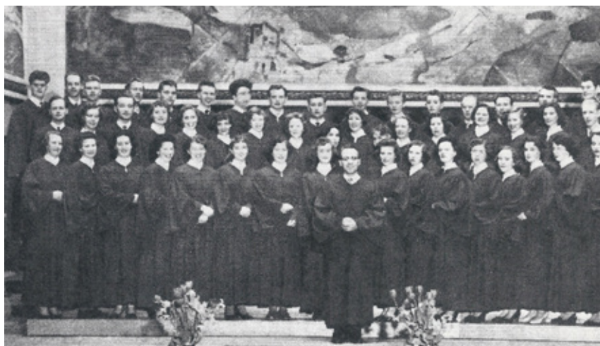
Kilder: Wikipedia, rogersandhammerstein.com, og div. nummer av Adventungdom på 1950-tallet.

Når du går gjennom storm, løft ditt hode mot sky, og frykt ikke natten lang. For ved stormens slutt fins det gylne gry, der skal du høre fuglenes sang. Gå på gjennom vind, gå på gjennom regn om din drøm enn ende må. Gå på, gå på, med håp i ditt sinn, du skal aldri ensom gå. Nei, aldri ensom gå.