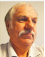
Thorvald Guleng: Opplevelser fra et fengsel s. 8